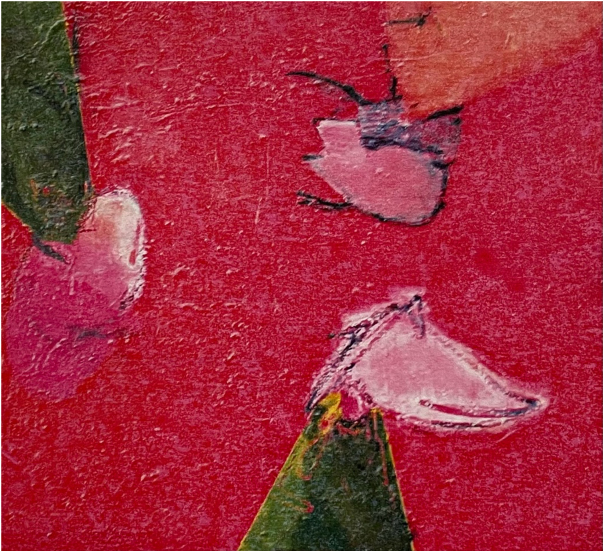
Waarom Weerom 2007